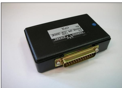
Software CP2 COD.: ACME09