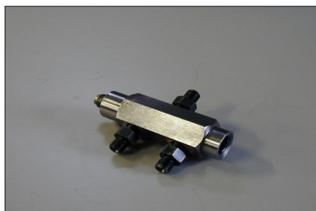
Rail Elementi CP2 COD.: 555-41-3