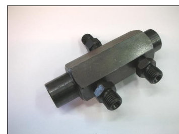
Rail Elementi CP2 COD.: 555-41-3