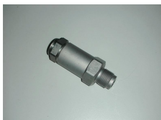
Valvola di sovrappressione tipo Bosch 1 110 010 035