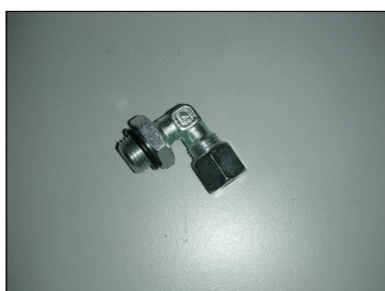
Raccordo 16x1,5 per ritorno pompa COD.: 555-CP9-V6