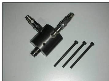
Adattatore regolatore COD.: 555-CP9-V5