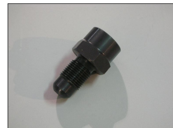
Raccordo ogiva COD.: 555-6-1