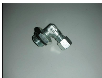
Raccordo 22x1,5 per alimentazione pompa COD.: 555-CP9-V7