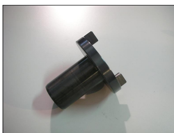
Giunto di trascinamento da Ø35 COD.: 555-CP9-V2