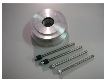
Flangia COD.: 555-CP9-V1