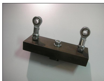
Culla di sicurezza COD.: 555-CP9-V3