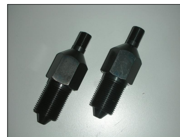
Raccordi uscita alta pressione COD.: 555-CP9-V4