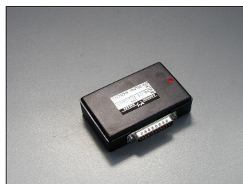
Software CP3 - Delphi - Siemens COD.: ACME07