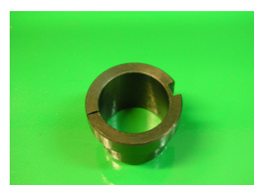
Adaptador electroinyectores \varnothing 29