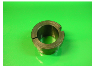
Adaptador electroinyectores \varnothing 26