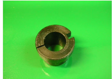
Adaptador electroinyectores \varnothing 22