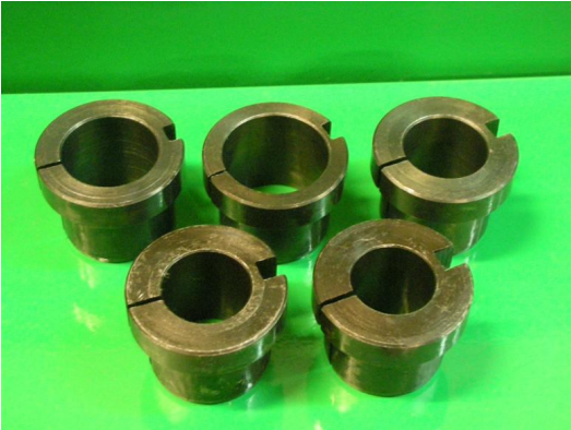
Kit adaptadores electroinyectores \varnothing 21-22-23-26-29