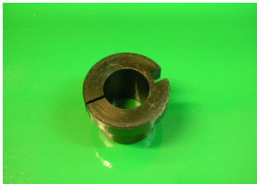
Adaptador electroinyectores \varnothing 19