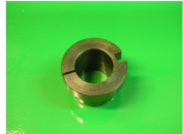
Adaptador electroinyectores \varnothing 23