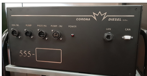
Simulatore automatico Common-Rail COD.: 555-FULL/PH