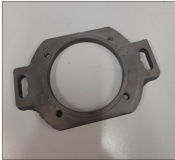
Flangia pompa COD.: CPN5F