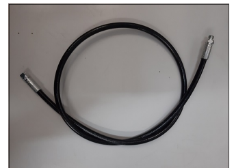
Tubo pressione di trasferta lunghezza 120 cm attacco 1/8 x 1/8 COD.: 555-66