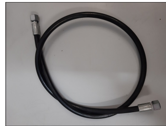
Tubo portata pompa da 1/4 lunghezza 120 cm attacco F/F COD.: 555-65