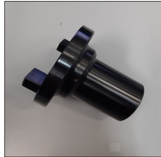
Giunto banco da Ø35 COD.: CDAG0035-01