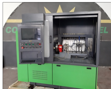
Banco di prova elettronico > 10 Kw tipo 555-@/NS o EPS707-15/N