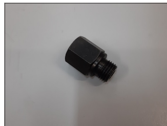
N°2 Riduzione tubo 16-14 COD.: CR30003-10