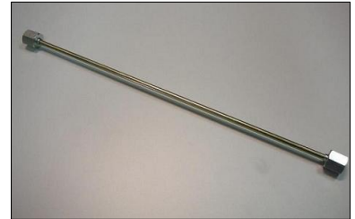
N°2 Tubo di collegamento uscita alta pressione 14-14 - 400 mm COD.: 555-55