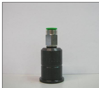
Raccordo iniettore COD.: 555-38-1