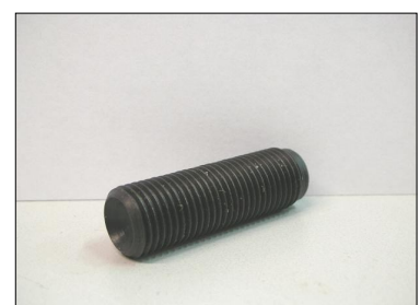
Vite Punteria COD.: 555-39-1