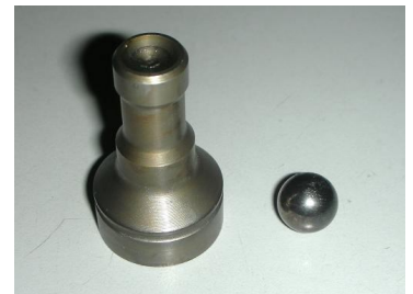
Perno Punteria COD.: F00V X99 887

* N.B.: Per chi possiede il vecchio Cam-Box Cod.555-24/ISO è necessario anche il software Cod.ACME10-ISO e la vite punteria Cod.555-39-1