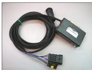
Software COD.: ACME10-ISO