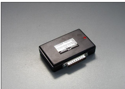
Software CP3-Delphi-Siemens COD.: ACME07