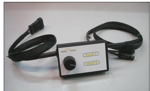
Selettore Elementi CP2 COD.: 555-41-4