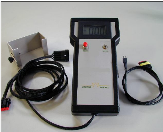
Captatore Lavoro regolatore