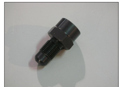
Raccordo ogiva COD.: 555-6-1