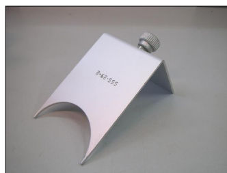
Tapa de protección contra salpicaduras COD.: 555-29-2