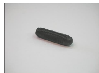
Tornillo Puntería COD.: 555-38-2