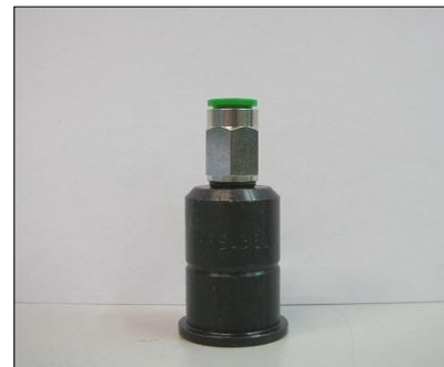
Rosca Inyector COD.: 555-38-1

* N.B.: Si usted posee el viejo Cam-Box Cód.555-24/ISO es necesario la Tapa de protección contra salpicaduras Cód.555-29-2 y el tornillo puntería Cód.555-38-2