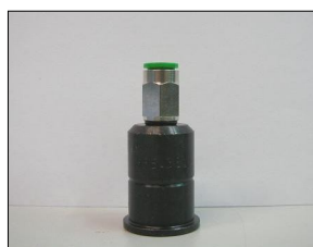
Raccordo iniettore COD.: 555-38-1

* Per la prova del pompa iniettore E3 4 pin è necessario il simulatore per diagnosi di impianti di iniezione "POMPA-INIETTORE" Cod.:555-24LX/EVO.