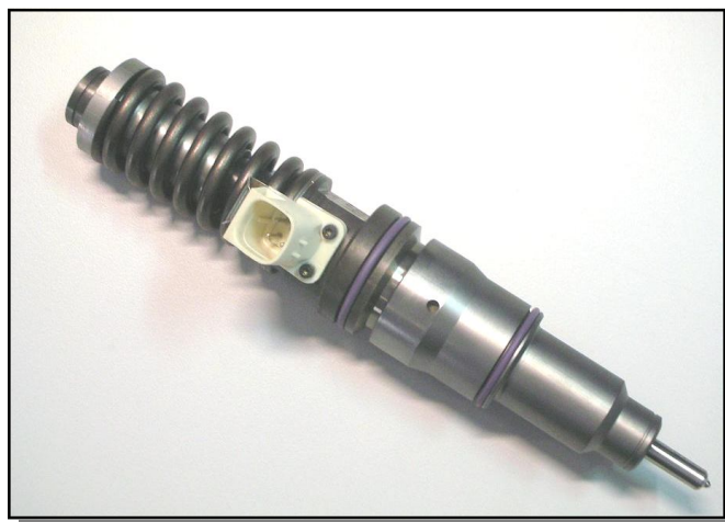
Kit COD.: 555-90*