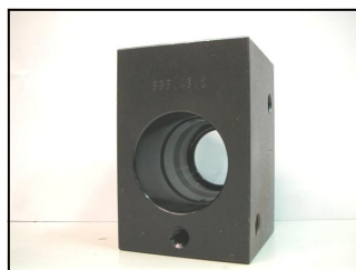
Blocchetto Pompa-Iniettore COD.: 555-48-1